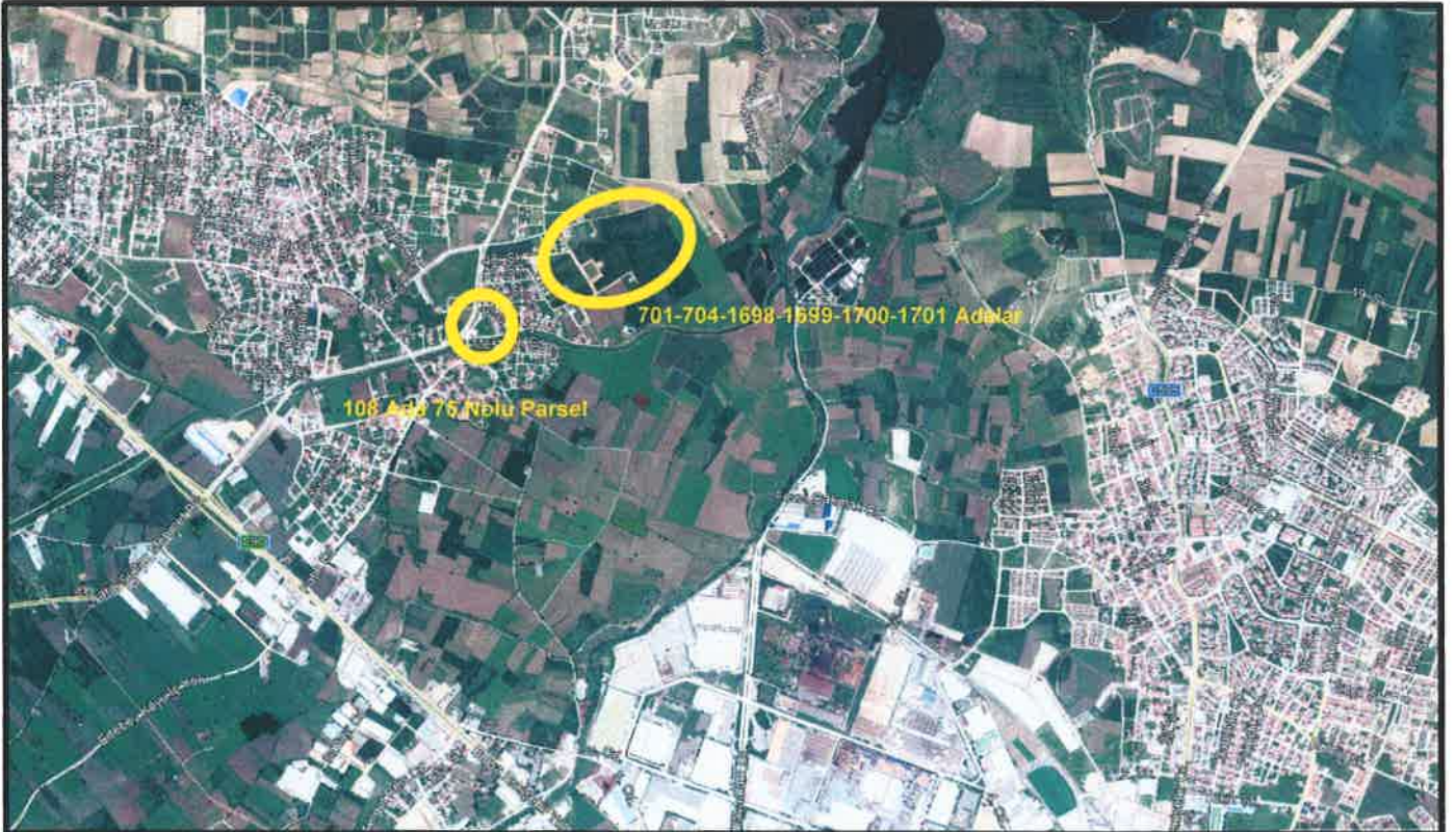
Şekil 1: Plan Değişikliğine Konu Alanın Konumu

Bursa İli, İnegöl İlçesi, Akhisar Mahallesi, 701-704-1698-1699-1700-1701 Adalar ile 108 Ada 75 Nolu Parsel; Bursa-Eskişehir Karayolunun yaklaşık 1400 metre kuzeyinde konumlanmış olup, 1698-1699 Adaların kuzeybatısında Yeşil Söğüt Sokak, 1698 Adanın batısında Umut Sokak, 1699 Adanın doğusunda Oğuz Sokak, 701-704 Adaların kuzeyinde, 1700 Adanın doğusunda Güzel Bahçe Sokak, 1701 Adanın güneybatısında Dekor Sokak, 108 Ada 75 Nolu Parselin güneyinde ise Tunca Caddesi bulunmaktadır.